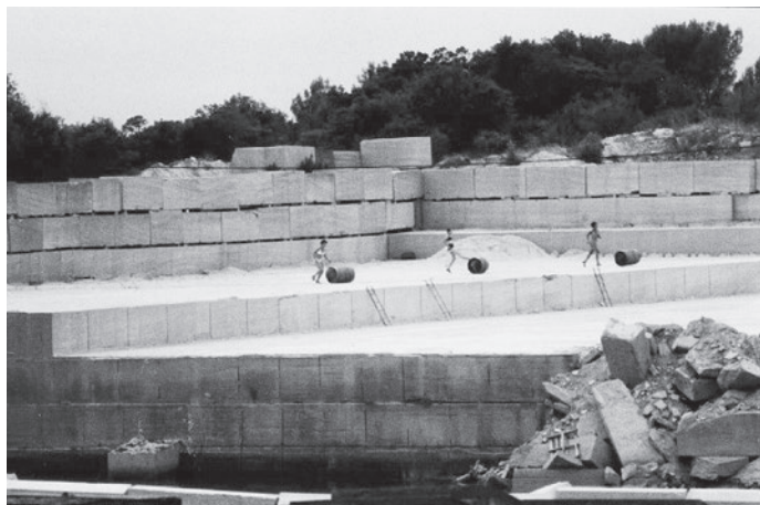
Et d'autres choses encore, Vers-Pont-du-Gard, 1998

en extérieur, avec vingt-cinq billes de bois issues d'une ancienne charpente, puis en 1998, dans une carrière de pierre, et enfin dans une architecture, en 2000.