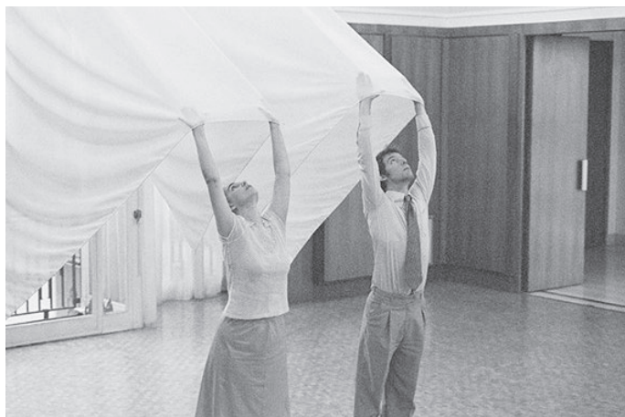
« OUI », Hôtel de ville, Le Blanc-Mesnil, 2004