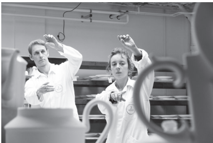
Les Trois Contents. Manufacture nationale de Sèvres, 2006

A la Manufacture de Sèvres, où la compagnie a été en résidence entre 2006 et 2008, je me suis attachée aux gestes de fabrication de la porcelaine, des céramistes, aux matériaux, aux formes des pièces produites dans les ateliers. Le lieu n'a rien d'exceptionnel, c'est une fabrique XIX e assez fonctionnelle. Ce qui est passionnant, c'est le trésor de savoir-faire qu'il renferme, le désir d'excellence depuis trois siècles. L'architecture industrielle m'intéresse par ses usages. Ses volumes sont rationnels, ont été créés pour que ça fonctionne, pour que ça circule aisément. Il y a un côté fonctionnaliste, la forme doit nécessairement suivre la fonction.