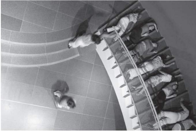
Printemps, Les Champs Libres, Rennes, 2008

Je commence à avoir un beau catalogue de projets pour des lieux qui sont dans tous les bouquins d'archi ! Des lieux qui ont été portés par une pensée. Ou alors des lieux qui ont une qualité spatiale particulière, due à leur histoire. Je pense à la piscine de Pantin. Bâtiment années 1930 qui n'est pas signé par un architecte célèbre, puisque c'est son seul bâtiment public, mais qui, par rapport à l'histoire des équipements nautiques, occupe une place importante, qui fait la jonction entre les lieux de bain et les lieux de sport. Ses espaces intérieurs, sa forme, sont marqués par cette transition. L'architecte Charles Auray était jeune, encore étudiant, c'est son premier projet, il a soigné tous les choix de matériaux. Par exemple, pour accentuer l'horizontalité du mur d'enceinte en briques rouges, il a fait réaliser les joints horizontaux plus larges que les joints verticaux. Les briques se chevauchent en exact quinconce et les joints épais créent un rythme, des lignes de fuite très graphiques. Derrière ce genre de détails, on sent une pensée, une volonté, un désir esthétique qui est moteur pour moi. Les danseurs peuvent s'accrocher aux briques, il y a la place pour les doigts, et ils savent ce qu'on met en scène en s'agrippant à cet endroit-là.