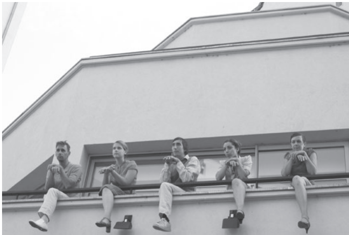
Là commence le ciel. Gratte-ciel de Villeurbanne, 2006