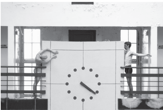
Visite dansée de la piscine de Pantin, 2005

Je commence à avoir un beau catalogue de projets pour des lieux qui sont dans tous les bouquins d'archi ! Des lieux qui ont été portés par une pensée. Ou alors des lieux qui ont une qualité spatiale particulière, due à leur histoire. Je pense à la piscine de Pantin. Bâtiment années 1930 qui n'est pas signé par un architecte célèbre, puisque c'est son seul bâtiment public, mais qui, par rapport à l'histoire des équipements nautiques, occupe une place importante, qui fait la jonction entre les lieux de bain et les lieux de sport. Ses espaces intérieurs, sa forme, sont marqués par cette transition. L'architecte Charles Auray était jeune, encore étudiant, c'est son premier projet, il a soigné tous les choix de matériaux. Par exemple, pour accentuer l'horizontalité du mur d'enceinte en briques rouges, il a fait réaliser les joints horizontaux plus larges que les joints verticaux. Les briques se chevauchent en exact quinconce et les joints épais créent un rythme, des lignes de fuite très graphiques. Derrière ce genre de détails, on sent une pensée, une volonté, un désir esthétique qui est moteur pour moi. Les danseurs peuvent s'accrocher aux briques, il y a la place pour les doigts, et ils savent ce qu'on met en scène en s'agrippant à cet endroit-là.