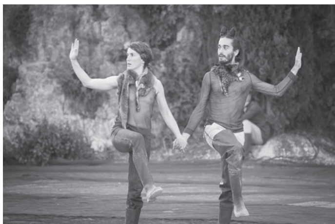
Tes jambes nues, Théâtre de verdure de Noves, 2013

Tu n'étais pas du tout inquiète de ce changement de configuration, cette adaptation aux lieux était même assez joyeuse.