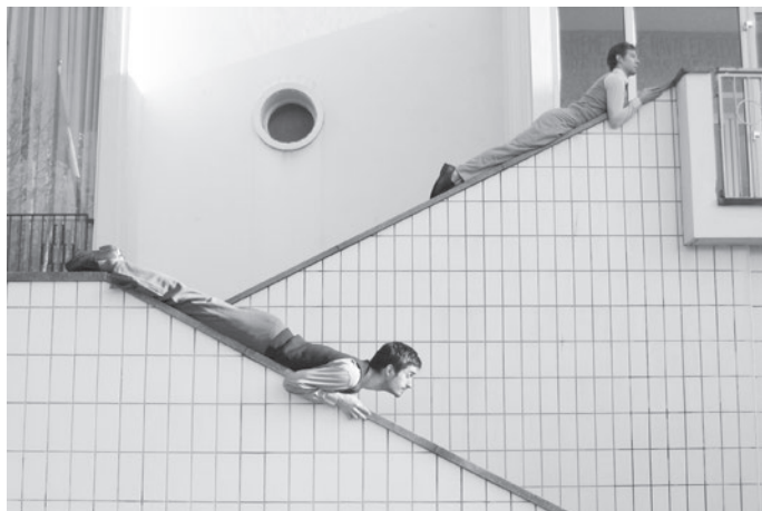
« OUI », Hôtel de ville, Le Blanc-Mesnil, 2004

3 www.compagniedesprairies.com Ou bien : après avoir attentivement observé les employés de mairie au travail, chacun isole quelques gestes de l'activité municipale, se les approprie pour être capable de les apprendre à un partenaire. On crée des duos qui enchaînent ces gestes en phrase dansée en faisant des choix de composition : répétitions, accélérations, suspensions, étirements du geste. Après quoi, on cherche à deux à inscrire cette phrase commune (pas forcément dansée à l'unisson bien sûr) dans les espaces du hall de la mairie : l'escalier, le perron intérieur, le bureau d'accueil, les bancs... On écrit donc un parcours à deux qui s'appuie sur les caractéristiques du lieu et dans lequel on déploie cette matière gestuelle puisée dans les comportements des employés. Quand je prépare mes répétitions, j'ai une idée en tête d'une scène, d'une action, et je cherche la proposition à faire aux danseurs qui pourrait les amener à cette action. Mais ce qui va se produire sur le « plateau » est toujours très différent de ce que j'avais imaginé. C'est cet écart qui m'intéresse et c'est à partir de cela que je vais écrire.