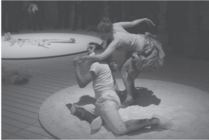
Les Trois Contents, Le Grand Hornu, Mons, Belgique, 2009