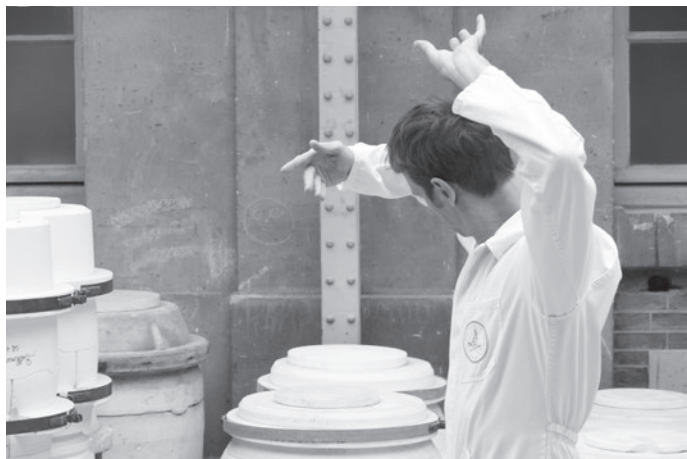
Les Trois Contents, Manufacture nationale de Sèvres, 2006

C'est en 2003 à la bibliothèque de Beaubourg que pour la première fois je n'ai pas guidé le public. Juste avant, j'avais été chorégraphe associée à un concert de Nicolas Frize, ça m'avait libérée du rapport scène/salle traditionnel. J'ai parlé alors d'environnement chorégraphique, car le public déambule librement et la danse est présente partout, autour de lui, on ne sait plus très bien qui est danseur et qui ne l'est pas. Insensiblement, ça étend un peu plus le domaine de la danse : cette personne, qui se baisse pour ramasser un livre, danse-t-elle ?