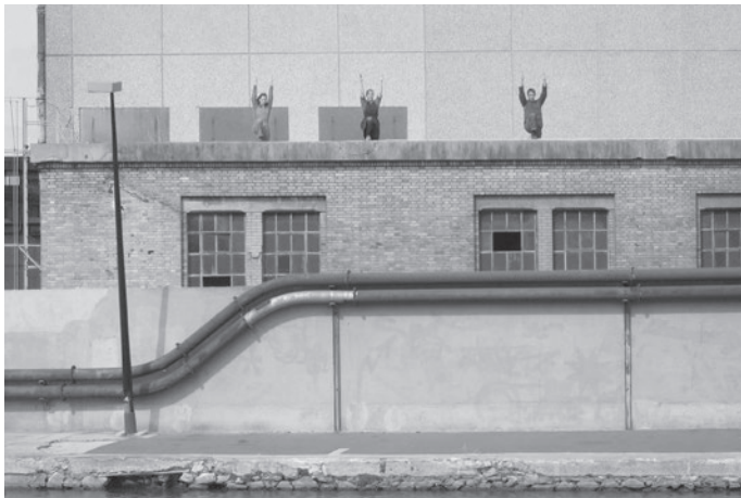
Roulés dans la farine. Grands Moulins de Pantin, 2004

A la Manufacture de Sèvres, où la compagnie a été en résidence entre 2006 et 2008, je me suis attachée aux gestes de fabrication de la porcelaine, des céramistes, aux matériaux, aux formes des pièces produites dans les ateliers. Le lieu n'a rien d'exceptionnel, c'est une fabrique XIX e assez fonctionnelle. Ce qui est passionnant, c'est le trésor de savoir-faire qu'il renferme, le désir d'excellence depuis trois siècles. L'architecture industrielle m'intéresse par ses usages. Ses volumes sont rationnels, ont été créés pour que ça fonctionne, pour que ça circule aisément. Il y a un côté fonctionnaliste, la forme doit nécessairement suivre la fonction.