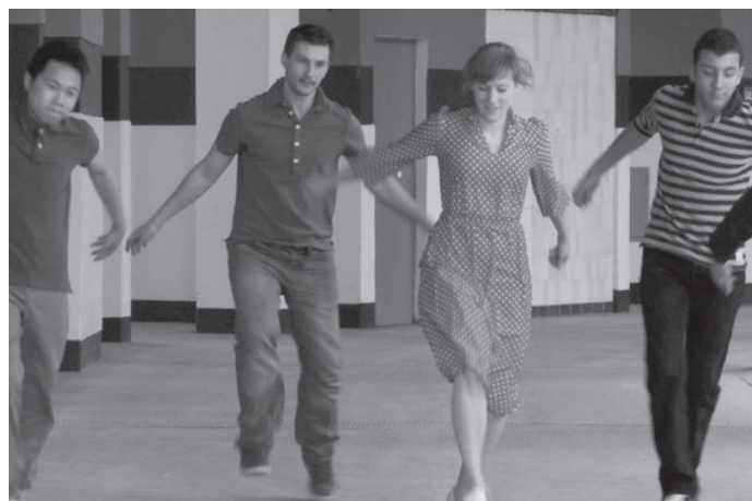
Après un rêve, La Villeneuve, Grenoble, 2012

C'est pour ça d'ailleurs que j'ai été amenée à faire un film à La Villeneuve de Grenoble, parce que je ne pouvais pas faire venir des spectateurs physiquement dans ce lieu, le contexte politique ne s'y prêtait pas, le quartier traversait une crise grave, ç'aurait été indécent.