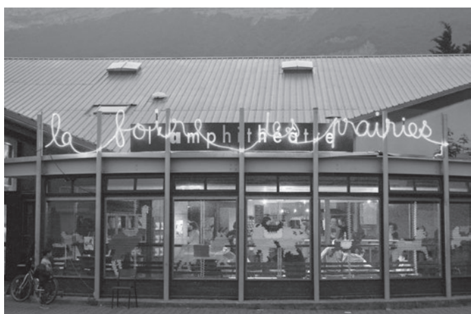
Foire des prairies, Le Pont-de-Claix, 2015

Les jardiniers, boxeurs, philatélistes, musiciens, danseurs folkloriques, twirleuses, cuisiniers, tricoteuses, bibliothécaires imaginent avec nous des attractions qui mettent en jeu le corps, invitent au mouvement.