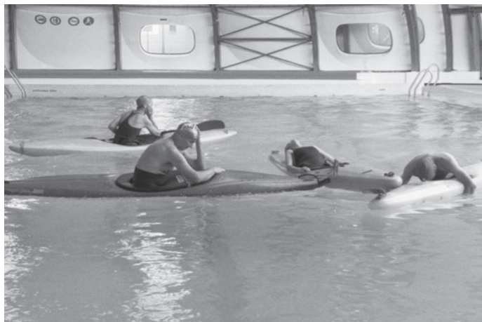
L'Architecte de Saint-Gaudens, 2014