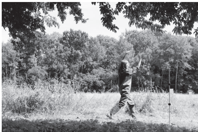
Le pantalon, l'été, la poule, la pastourelle, la boulangère Parc Rousseau d'Ermenonville, 2015

à Cavailon, quand la scène nationale m'a invitée. J'ai préféré travailler sur l'agriculture ; les gestes, les matériaux, la culture agricoles.