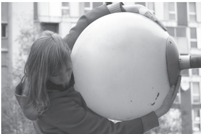
Après un rêve. La Villeneuve, Grenoble, 2012